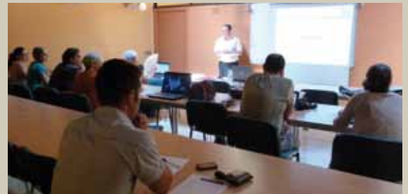
El curs s'ha fet en dues sessions, a la Sotacoberta d'El Castell.

El curs és totalment gratuït per als comerciants i s'ha ofert amb el suport de la Cambra de Comerç.