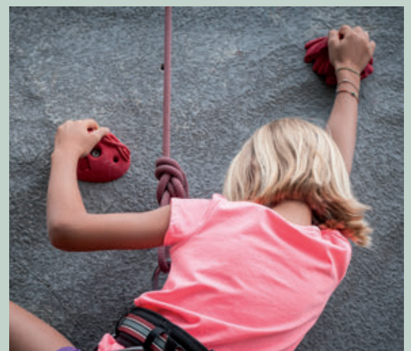
Parc d'escalada infantil.