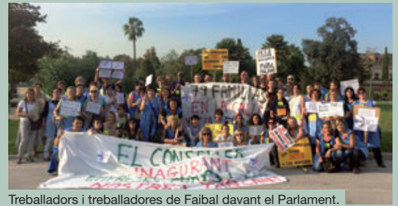
Treballadors i treballadores de Faibal davant el Parlament.