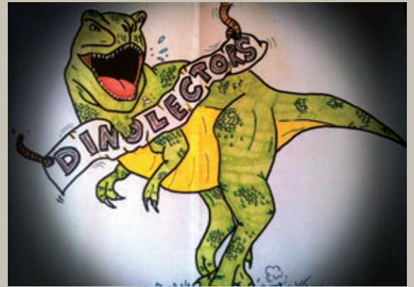
Il·lustració del programa elaborada per Marta Gil Borrell i Selenia Lopez Sanchez.

El programa compta amb el suport del Museu de l'Institut Català de Paleontologia Miquel Crusafont.