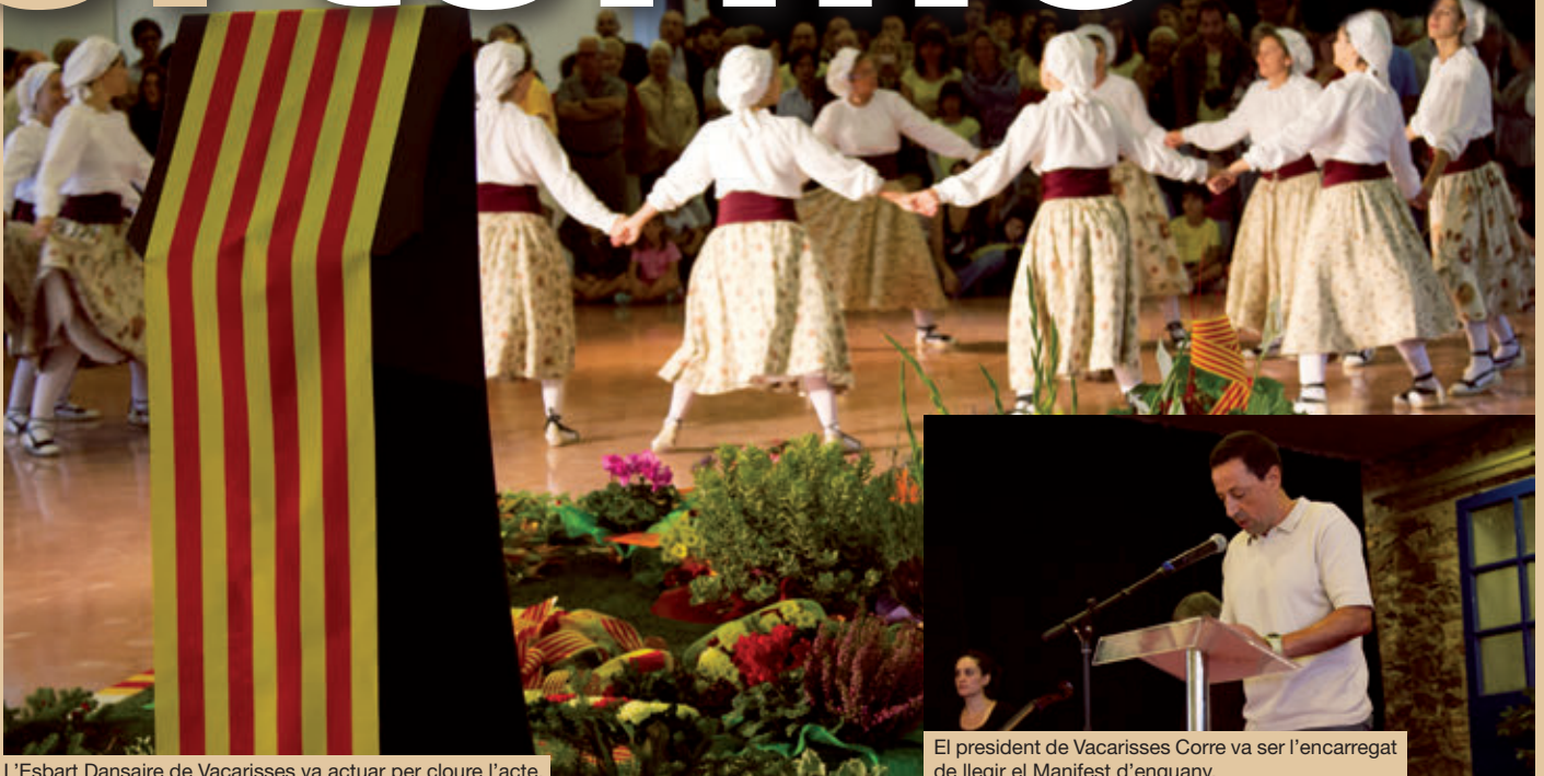
L'Esbart Dansaire de Vacarisses va actuar per cloure l'acte.

www.vacarisses.cat el terme@vacarisses.cat