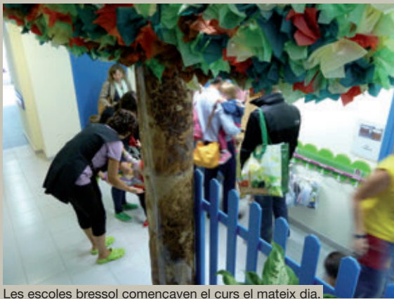
Les escoles bressol començaven el curs el mateix dia.