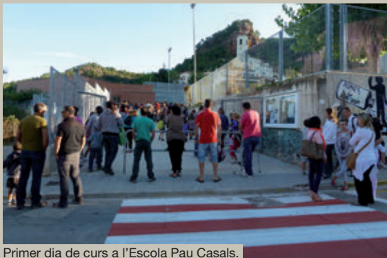
Primer dia de curs a l'Escola Pau Casals.

A aquestes xifres cal sumar-hi els 182 nens i nenes que s'han matriculat per aquest curs a l'Escola Municipal de Música de Vacarisses.