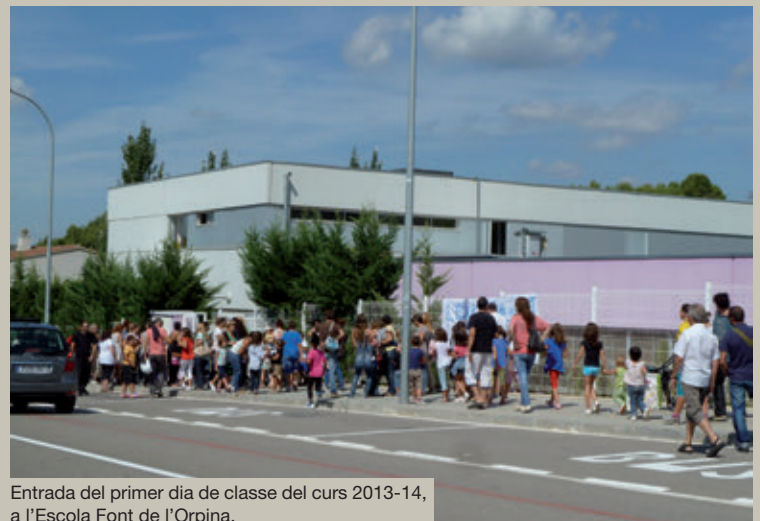
Entrada del primer dia de classe del curs 2013-14, a l'Escola Font de l'Orpina.