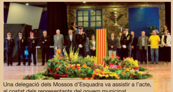
Una delegació dels Mossos d'Esquadra va assistir a l'acte, al costat dels representants del govern municipal.