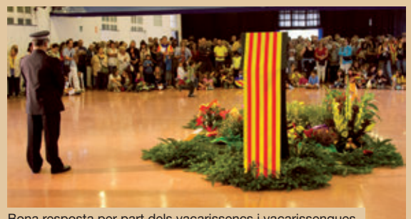
Bona resposta per part dels vacarissencs i vacarissenques.