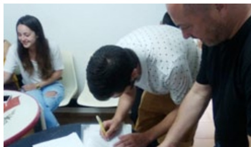
El president de l'associació i l'alcalde de Vacarisses signant el conveni.

Ara han donat un altre gran pas, signant un conveni amb l'Ajuntament de Vacarisses per cedir-los l'ús de la sala dels vestidors de la pista poliesportiva municipal del Ventaiol. D'aquesta manera, l'entitat podrà utilitzar-la com a local social.