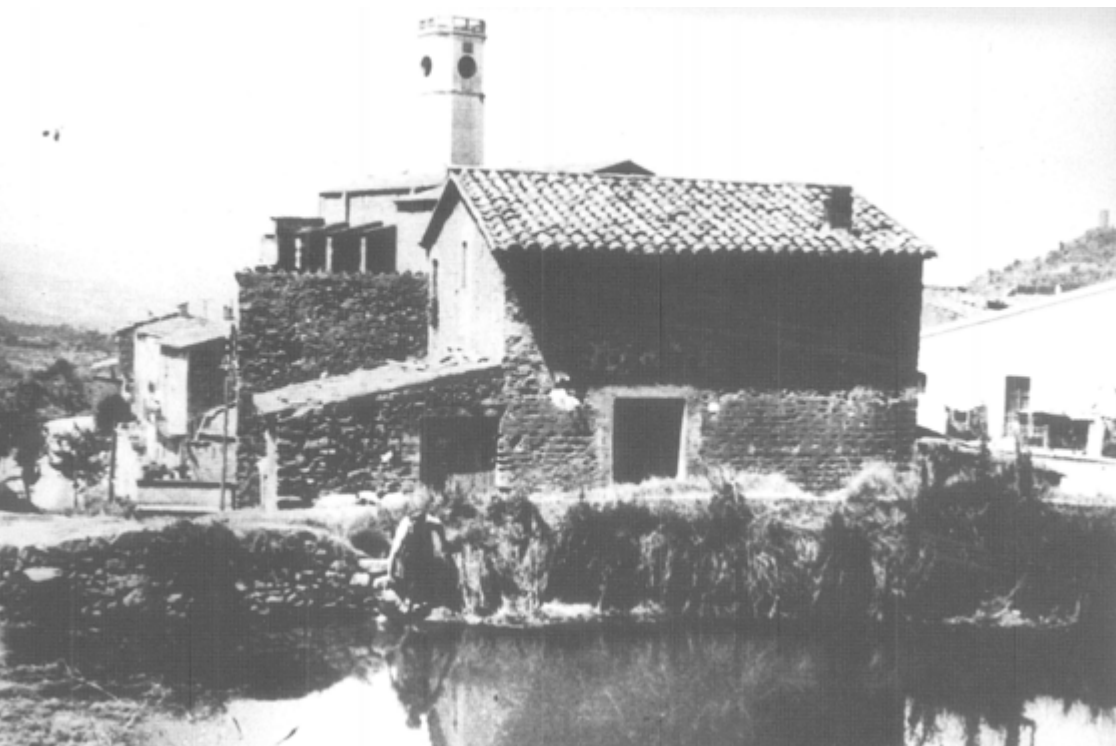
Cal Josepó i, en primer terme, la bassa del Castell. Any 1940.