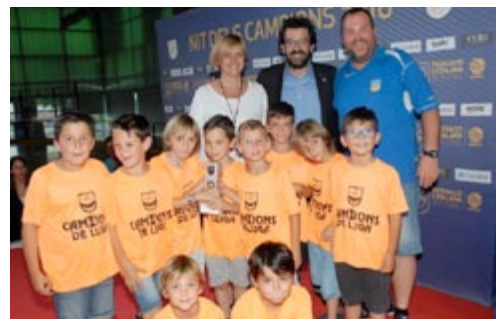
Prebenjamí. Futbol 7.