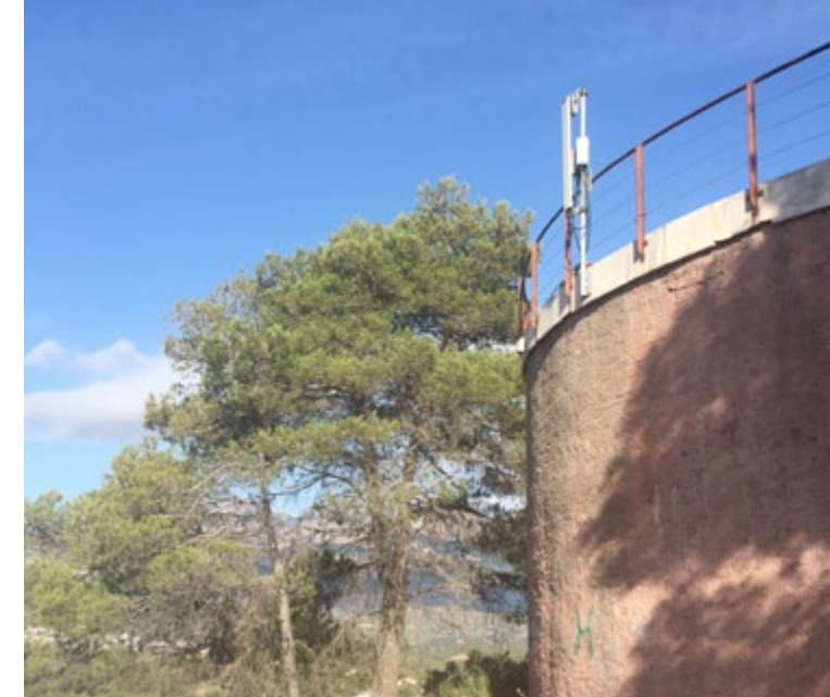
Dipòsit d'aigua de Vacarisses.

S'han posat reguladors a la xarxa. Els reguladors baixen la pressió a les canonades i eviten fuites i, en cas d'haver-n'hi, minimitzen aquesta fuga. Encara se n'haurien de col·locar entre 8 i 10 més per tenir "regulada" tota la xarxa a Vacarisses. Per altra banda, també es col·locarà un comptador a la zona de La Colònia Gall per detectar si hi ha pèrdues en aquesta part de la xarxa.