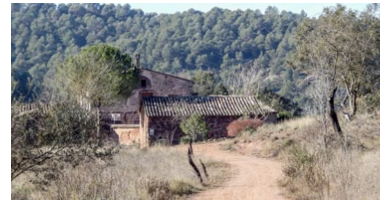
Masia de les Vendranes.