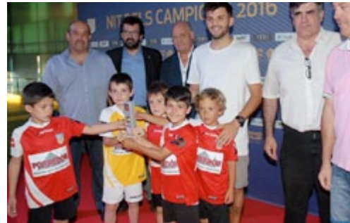
Prebenjamí. Futbol Sala.