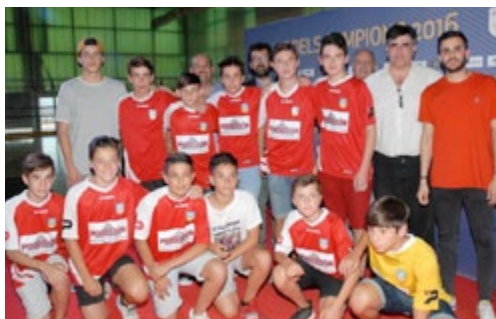
Infantil. Futbol Sala.