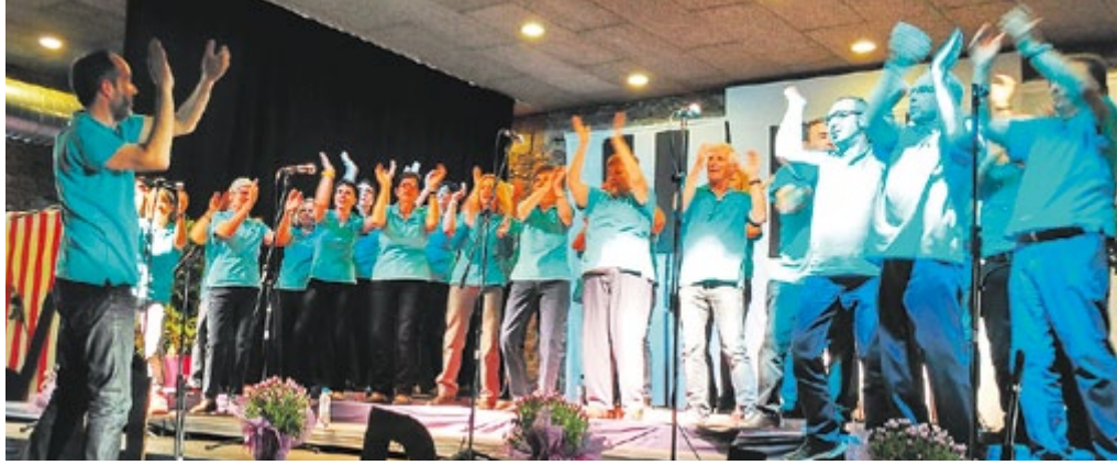
Actuació del Cor de Vacarisses a la XX Trobada de Corals.