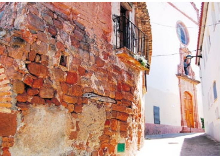
Cal Ferrer Vell