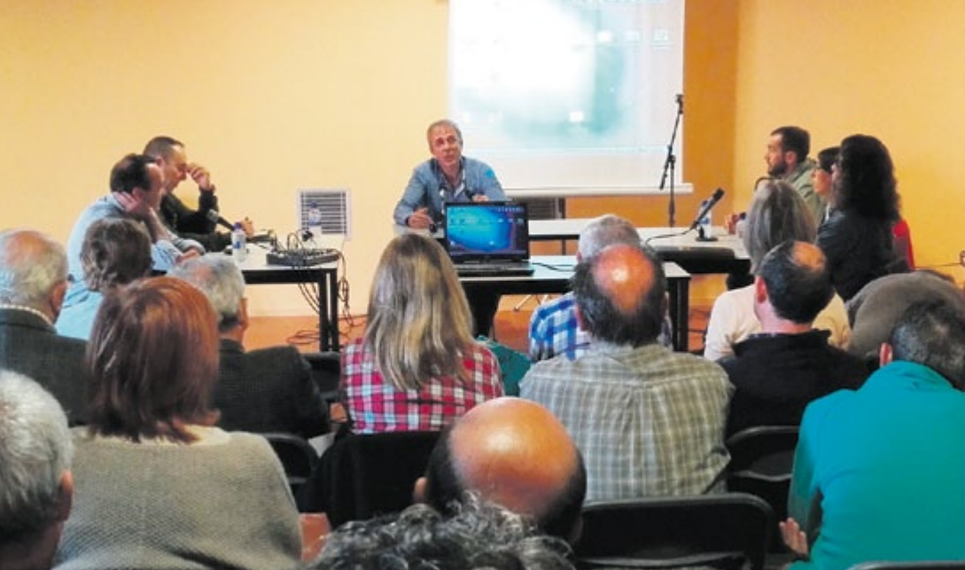
Taula rodona a la Sala dels Cups d'El Castell.