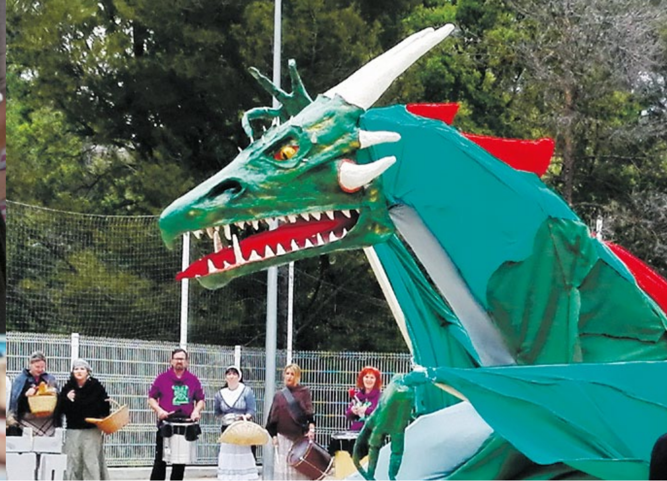
Sant Jordi 2016