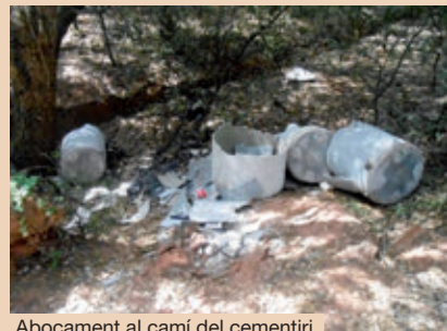
Abocament al camí del cementiri.

La deixalleria municipal de Vacarisses no està autoritzada per rebre fibrociment, ja que la seva adaptació generaria unes despeses inassumibles per un municipi com el nostre. Per aquest motiu, des de la Regidoria de Medi Ambient, es fa una crida a portar el fibrociment a la deixalleria de Terrassa, on disposen de personal preparat i recipients específics per dipositar-lo.