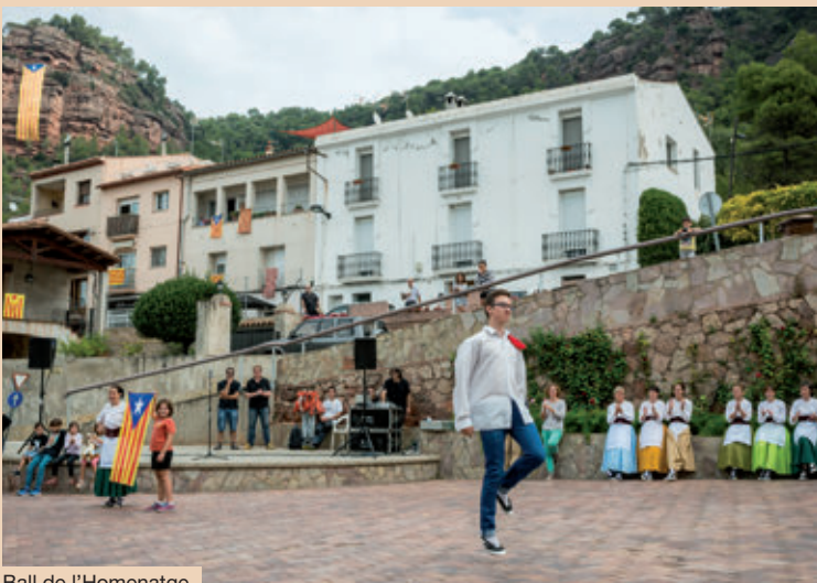
Ball de l'Homenatge.