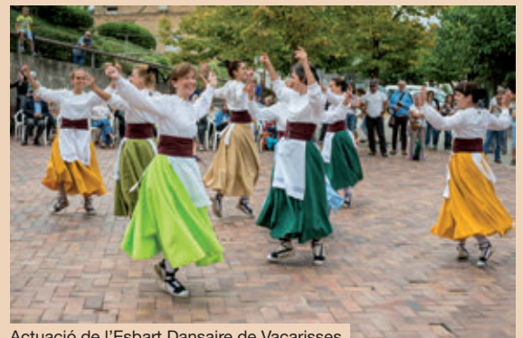
Actuació de l'Esbart Dansaire de Vacarisses.