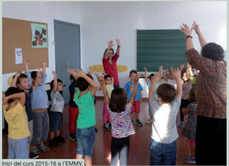
Inici del curs 2015-16 a l'EMMV.

Les escoles bressol El Cuc i El Xic compten amb 45 i 26 infants, respectivament; l'Escola Font de l'Orpina té 335 alumnes i l'Escola Pau Casals, 424. Per la seva banda, a l'Institut de Vacarisses, s'hi han matriculat 404 alumnes, un 7% més que el curs anterior. Aquest increment correspon, sobretot, als nivells de 2n i 4rt d'ESO.