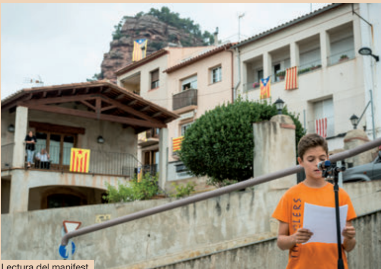
Lectura del manifest.

La celebració de la Diada a Vacarisses en imatges