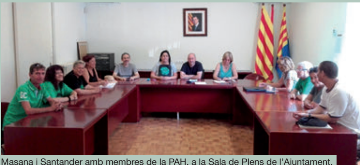
Masana i Santander amb membres de la PAH, a la Sala de Plens de l'Ajuntament.

El següent pas de la regidoria és reunir-se amb representants de les caixes amb oficina a Vacarisses.