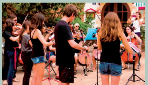
Autor: David Bea

La setmana del 15 de juny, la Sala dels Cups d'El Castell va acollir les audicions d'instrument de l'alumnat de l'EMMV. Cada tarda, en dues sessions, el públic va poder escoltar el progrés dels alumnes de clarinet, saxo, trombó, flauta travessera, guitarra, piano, violí i violoncel. Dimarts, també va tenir lloc l'audició d'adults, amb una mostra del treball realitzat als grups instrumentals i al taller d'orquestra orff.