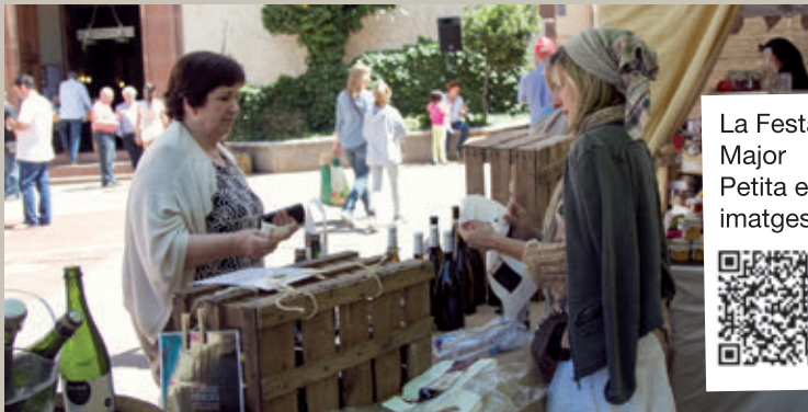
La Festa Major Petita en imatges

A la programació de la Festa Major Petita de 2015, també hi va tenir cabuda l'esport, amb el VI Cross Escolar i la V Crono pujada El Cingle ,