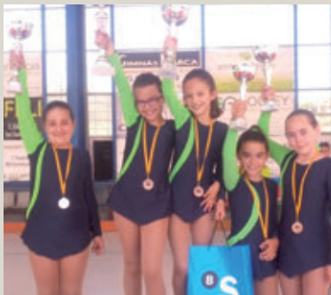
Les patinadores del CPA Vacarisses que van pujar al pòdium del I Trofeu Montserrat.

El diumenge 17 de maig, el Club de Patinatge Artístic (CPA) de Vacarisses va organitzar el I Trofeu Montserrat. Va tenir lloc al pavelló municipal de Sant Vicenç de Castellet i hi van participar diferents clubs, a banda del vacarissenc: CPA Viladecavalls, CPA Sentmenat, Escola Vedruna i Club Egara. En total, sumaven més de 60 patinadors i patinadores convidades.