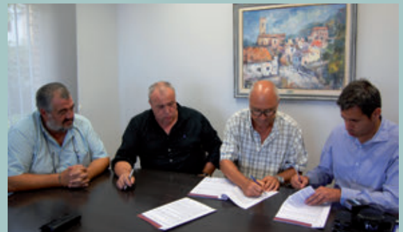
L'alcalde de Vacarisses, el secretari de l'Ajuntament i el gerent de GICSA signant el contracte per les obres de La Coma un cop acabat el ple.