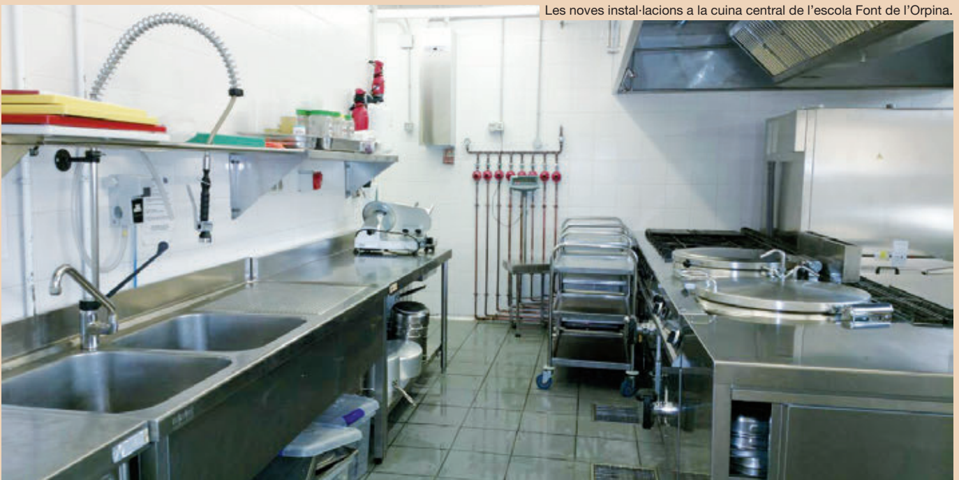
Les noves instal·lacions a la cuina central de l'escola Font de l'Orpina.