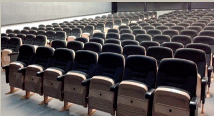
Una de les millores al Casal de Cultura ha estat la substitució de l'encoixinat dels seients.

En el cas de les instal·lacions esportives, al Poliesportiu municipal s'han adquirit dos mòduls units: un per al servei de bar de la zona esportiva i un altre per als lavabos de la zona del camp de futbol. A més, s'ha construït un envà per separar la zona de vestidors de la pista poliesportiva, amb la finalitat d'estalviar gasoil del sistema de calefacció. D'altra banda, s'han arranjat les pistes poliesportives de les urbanitzacions de Vacarisses.