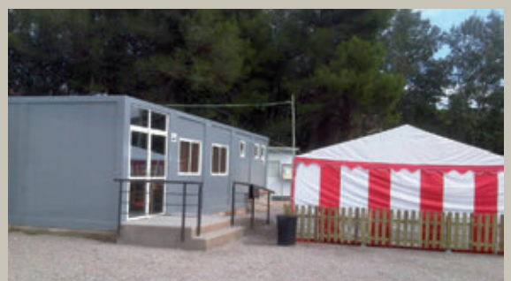
Un dels mòduls que s'ha instal·lat al Poliesportiu municipal.