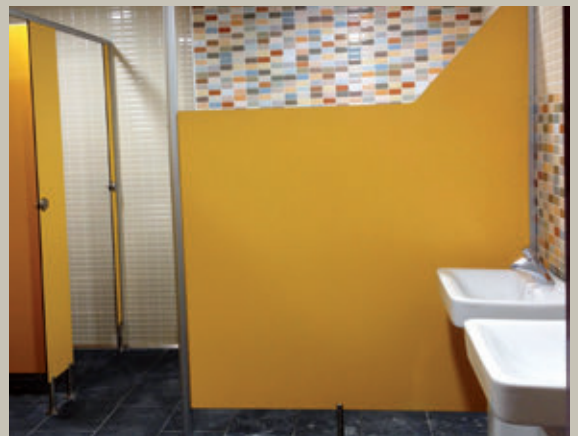
Ampliació dels lavabos de la sala polivalent de La Fàbrica.

1 Els imports marcats amb un asterisc estaven pendents de certificar al tancament d'aquesta edició del Terme.